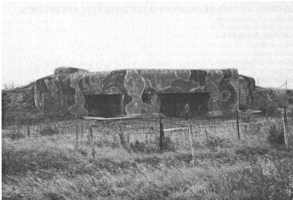
1. Pěchotní srub MJ-S 3 "Zahrádka" v Šatově u Znojma - pohled na týlovou část.